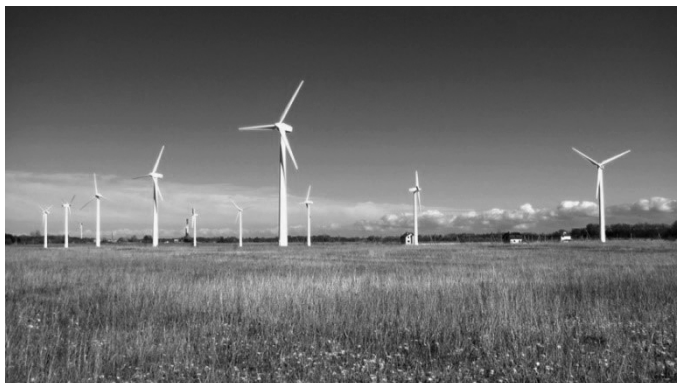
Ветропарк в Калининградской области

(2) В России же есть своя специфика. В отрасли газовой и атомной энергетики работают тысячи людей, они не могут просто так потерять свои рабочие места. К тому же, в России нет дефицита электроэнергии, поэтому нет острой потребности в развитии альтернативных источников энергии.