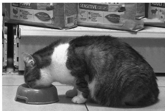
Кадры тульского телевидения