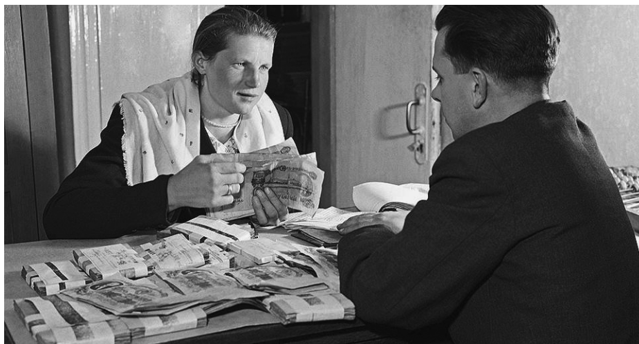
Колхозная бухгалтерия в 1953 году: выдача зарплаты наличными деньгами

Lees eerst de opgave(n) voordat je naar de tekst gaat.