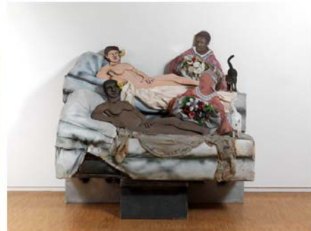
Rivers, I like Olympia in blackface , 1970