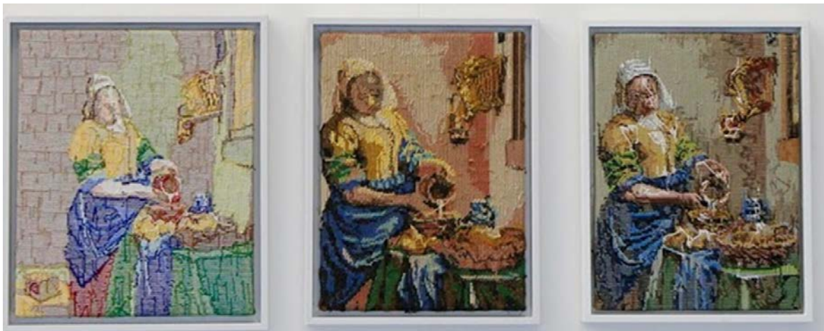
Voorbeeld van drie werken die Rob Scholte presenteerde in de solotentoonstelling Embroidery Show, 2016

Het examen bestond uit drie opgavenblokken, waarvan het laatste blok met een gemiddelde p'waarde van .57 het moeilijkste was. Er waren in het gehele examen twee vragen met een p'waarde hoger dan .85 en dat betekent dat er, behalve deze twee, nauwelijks echt makkelijke vragen in het examen zaten. Het examen bevatte twee vragen die (erg) moeilijk waren, deze hadden een p'waarde lager dan .40.