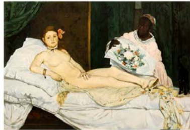
Manet, Olympia , 1865