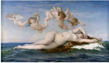
Cabanel, Venus , 1863