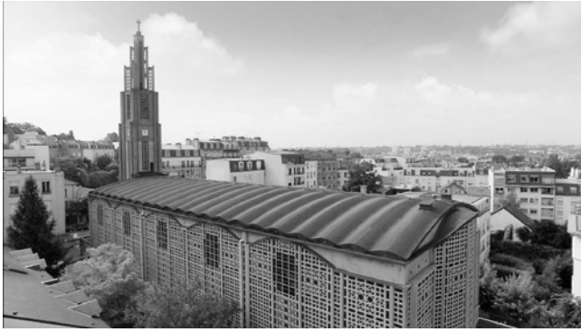
Auguste Perret, Notre-Dame du Raincy, 1923