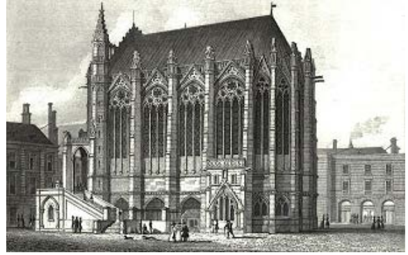
Sainte Chapelle, dertiende eeuw