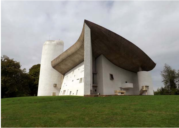
Le Corbusier, Notre-Dame du Haut, 1955

Een bijzonder voorbeeld van vernieuwing in typologie vormde de kerk Notre-Dame du Haut uit 1955 van Le Corbusier (een leerling van Perret). De architectuurhistoricus Charles Jencks typeerde deze kerk als een 'knoestige bedevaartsgrot' en schreef dat Le Corbusier hiermee de basis voor het postmodernisme legde. Kandidaten moesten deze uitspraak onderbouwen op basis van de architectuur van de Notre-Dame du Haut.