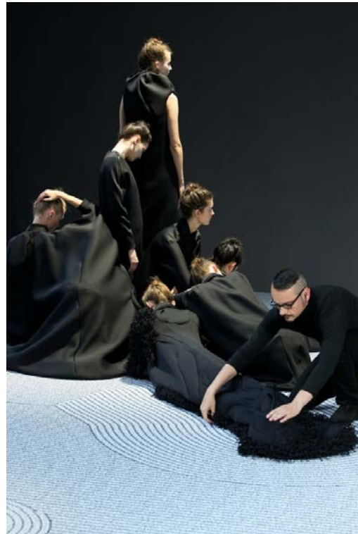
Viktor&Rolf, show van de herfst- en wintercollectie 2013