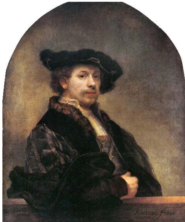
Rembrandt, Zelfportret , 1640

Schilderijen waarin het portret van de kunstenaar centraal staat kennen we vooral sinds de renaissance. Hoewel de redenen voor het maken van dergelijke portretten van tijd tot tijd verschillen, is duidelijk dat kunstenaars naar elkaars portretten keken. Ze kopieerden houdingen en gelaatsuitdrukkingen van elkaar, en tegelijkertijd probeerden ze vaak hun eigen kunnen te demonstreren. Waarom koos Rembrandt een (vermoedelijk) zelfportret van de Italiaanse kunstenaar Titaan als voorbeeld? En waarom maakte Rembrandts leerling Govaert Flinck een zelfportret dat verdacht veel lijkt op dat van zijn leermeester? Over dergelijke kwesties bogen zo'n 2.300 examenkandidaten zich tijdens het centraal examen tehatex vwo op 28 mei 2018.