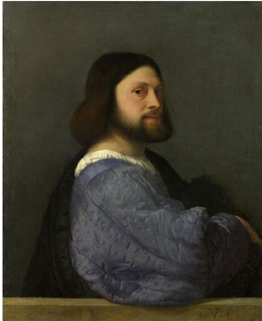
Titiaan, Portret van een man , 1509 (afbeelding 1 uit het examen)