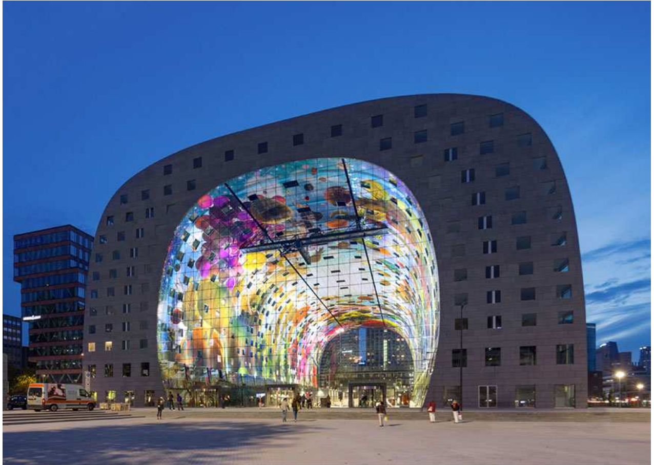
MVRDV, De Markthal, Rotterdam