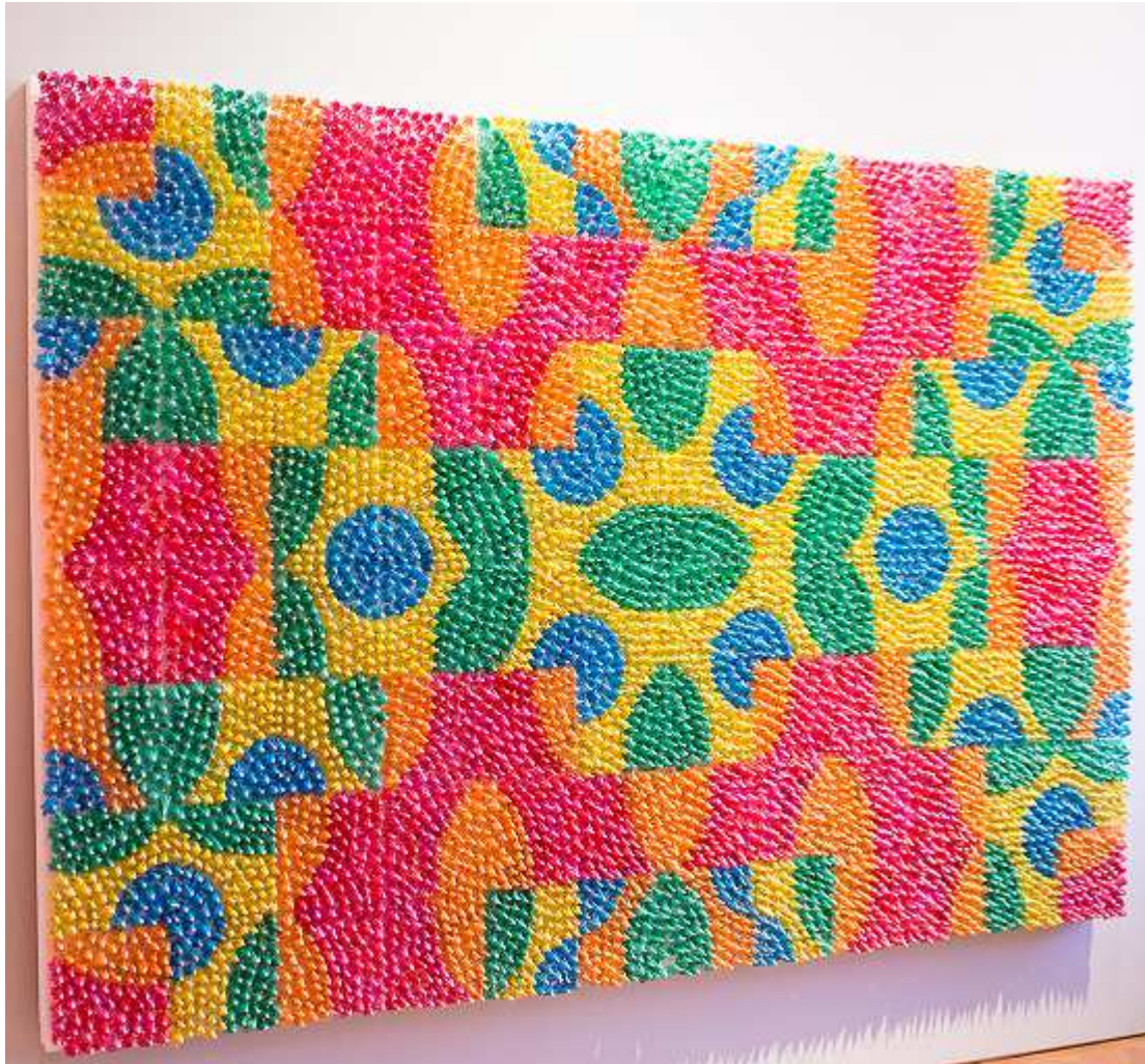
We Make Carpets, Umbrella Carpets 2, 2015

volgens hen vooral lastig nakijken was. Uit de analyse blijkt dat dit opgavenblok (met een gemiddelde p'-waarde van .64) het makkelijkst was.(1) Het relatief grote aantal vragen over vormgeving en minder vragen die kennis van de kunstgeschiedenis toetsen, zullen daaraan hebben bijgedragen.