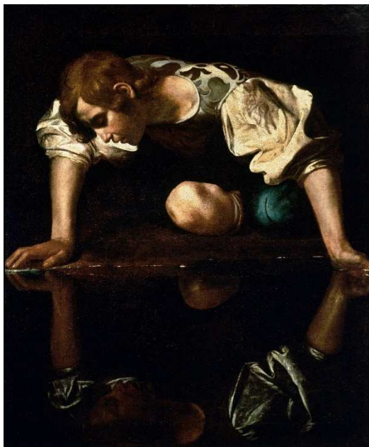
Caravaggio, Narcissus, 1598

Het examen opende traditiegetrouw met architectuur. In 'Een superpassage' stond de Markthal van architectenbureau MVRDV centraal. De voorstelling op het gewelf van deze markthal liet zich goed vergelijken met een virtuoze plafondschildering van een barokkerk uit Rome. Dit opgavenblok toetste kennis van de barok evenals inzicht in de manier waarop hedendaagse kunstenaars teruggrijpen op oude 'verleidingstactieken', maar dan met andere middelen en doelen. Docenten beoordeelden het opgavenblok als leuk, maar lastig. De ervaring leert dat leerlingen moeite hebben met architectuur, een vakgebied dat ze meestal alleen uit de theorie kennen en niet uit de praktijk, zoals tekenen en handvaardigheid. De examenmakers wilden leerlingen tegemoetkomen met enkele vragen over de schildering in de koepel van de kerk. Echter, de vraag over het ontwerp van het gebouw bleek juist de makkelijkste vraag van het blok, en die over kenmerken van barokke schilderkunst en het doel dat de kerk met deze kunst heeft, de moeilijkste.