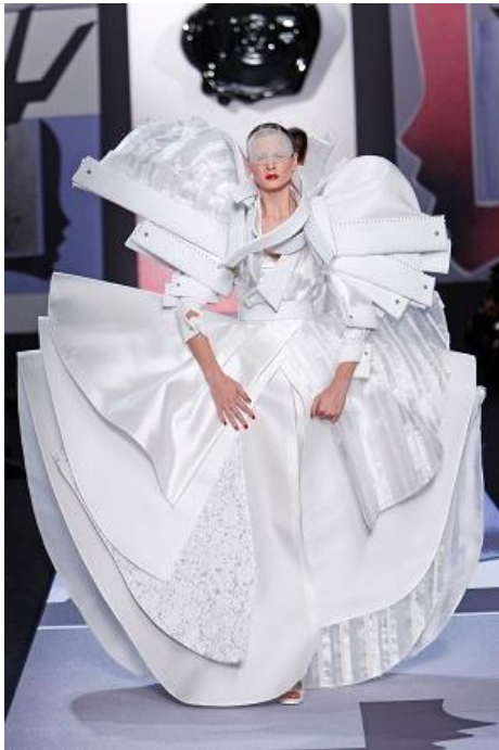
Viktor & Rolf, bruidsjurk uit de collectie Shirt Symphony , 2012

moet worden toegepast op een onbekend voorbeeld, blijken elk jaar weer tot de moeilijkste van het examen te horen. Dat gold ook voor de vraag naar kenmerken van het kubisme in een bruidsjurk van Viktor & Rolf (het opgavenblok over mode).