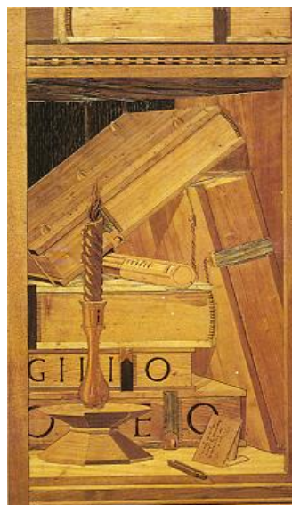
Giuliano da Maiano, details van houten inlegwerk, bibliotheek in het Dogenpaleis, Urbino